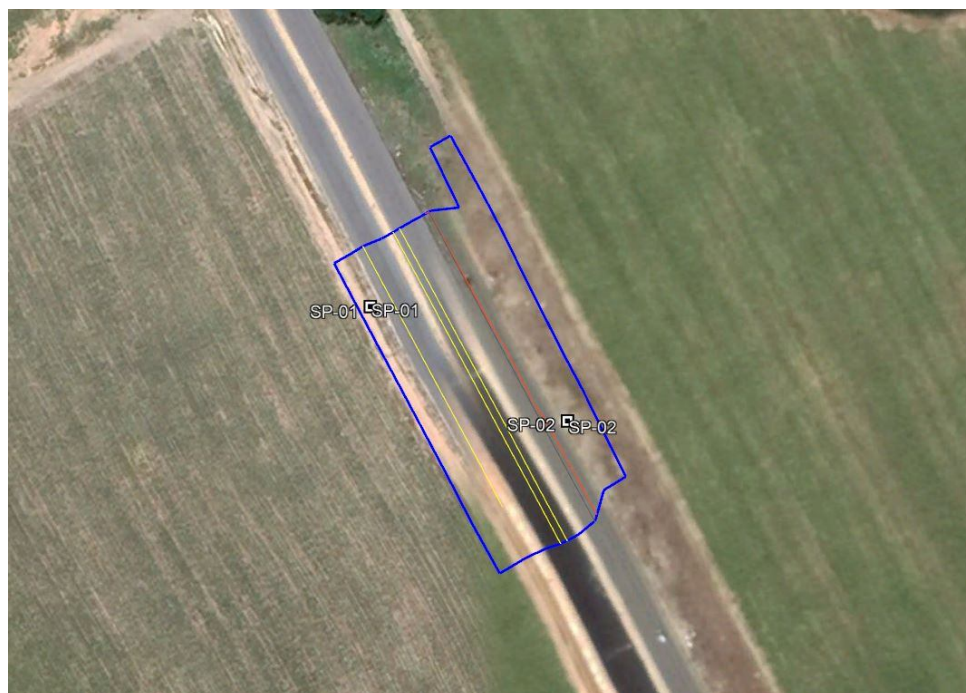
FIGURA 3 - LOCALIZAÇÃO DO PÓRTICO VELEIRO V3, AVENIDA CACHOEIRA DO MEIRIM, BENEDITO BENTES, MACEIÓ/AL.