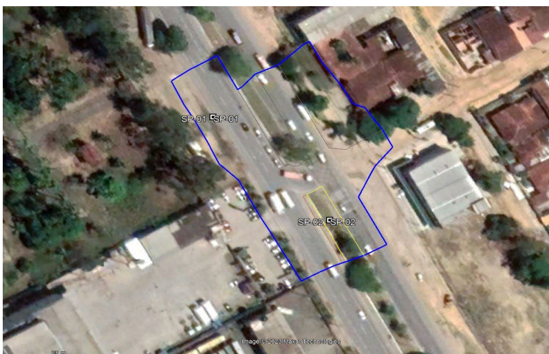
FIGURA 2 - LOCALIZAÇÃO DO PÓRTICO VELEIRO V2, AVENIDA LOURIVAL MELO MOTA, CIDADE UNIVERSITÁRIA, MACEÍO/AL.