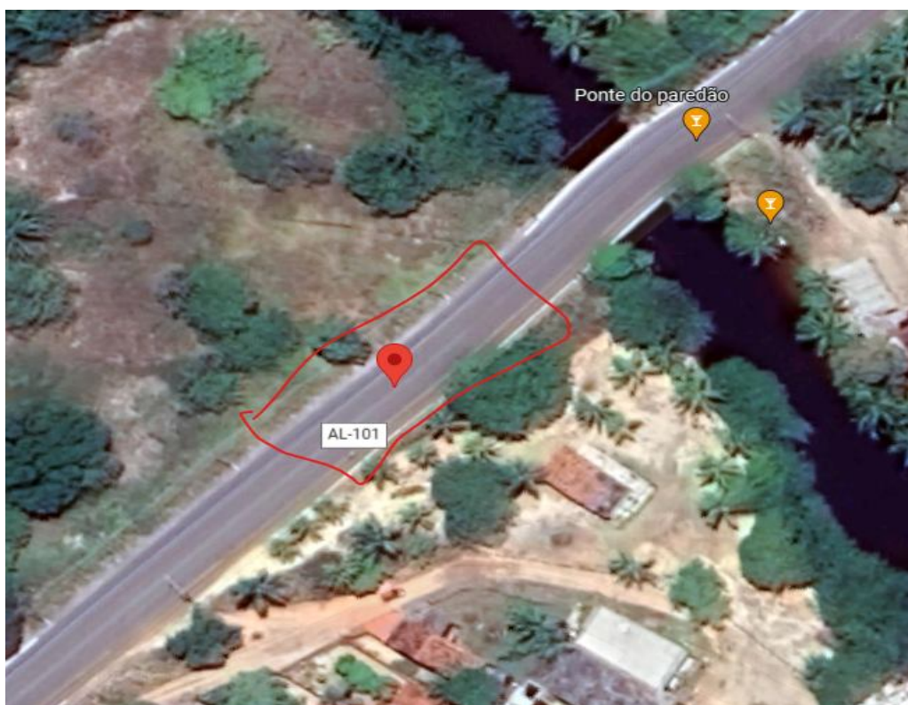
FIGURA 5 - LOCALIZAÇÃO DO PÓRTICO VELEIRO V5, AVENIDA GEN. LUIZ DE FRANÇA ALBUQUERQUE, IPIOCA, MACEIÓ/AL